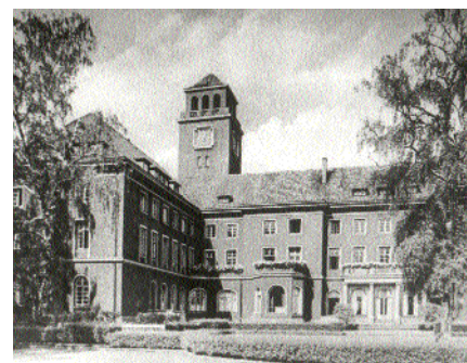
Rathaus um 1930

In den letzten Jahren fanden umfangreiche Restaurierungen der historischen Räume und 2003 auch ein dritter Neuanstrich der Fassade statt.