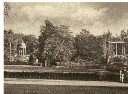
Blick vom oberen Rathauspark mit der Rosenpergula zum unteren Teil, Postkarte um 1930

1924 gingen Villa und Park in den Besitz der Stadt Bergedorf. 1925 fand auf dieser parkähnlichen Gesamtanlage, in der Villa und einigen Nachbargärten, die „Gartenbau-Ausstellung Bergedorf 1925“ statt. Zwischenzeitlich wurde der Park mehrfach umgestaltet, wie z. B. der Freilichtbühnen-Bereich und die Anlegung des Spielplatzes-Geländes, wobei Grundformen der Altanlage noch heute zu erkennen sind.