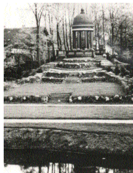
„Antiker Säulentempel“ um 1930 - er stand auf dem Platz der späteren Freilichtbühne