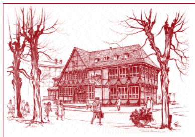
Diese vier Götze-Originale übergab der BBV dem Museum für die Sammlung.