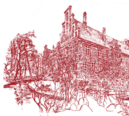
Wolfgang-Götze-Zeichnung von 1974

Der Hamburger Zeichner Wolfgang Götze (1906-88) hatte seit den 50er-Jahren viele Häuser und Straßenpartien Hamburgs in weit über 1000 Zeichnungen festgehalten. Seine große Liebe galt Bergedorf und dem Landgebiet, Hier war er 1970-85 häufig mit dem Zeichenblock unterwegs; 1974 erschienen 12 Motive in der Mappe „Sachsantor“.