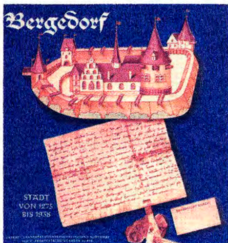
Bergedorf-Werbung aus dem Jahr 1938 erinnert an die Selbstständigkeit.